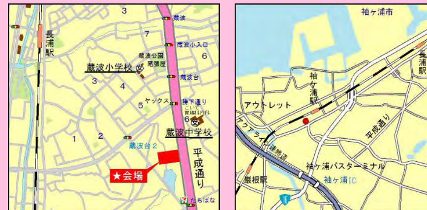
カーナビ：袖ヶ浦市蔵波2902付近